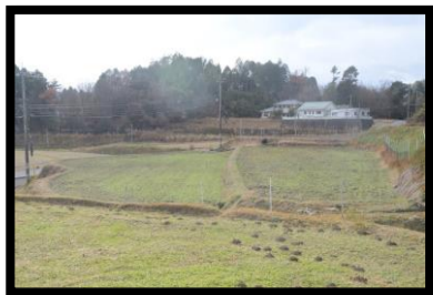
活動のフィールドとなる休耕田