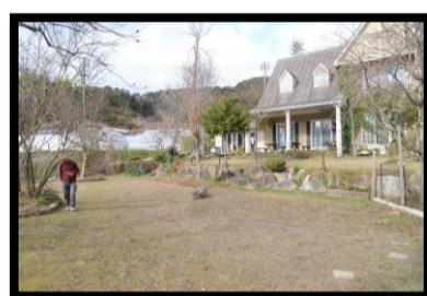
犬が自由に遊べる広場